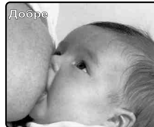
Малюнок на листівці "МатеринськеГодування" від Ради Здоров'я Андалусії