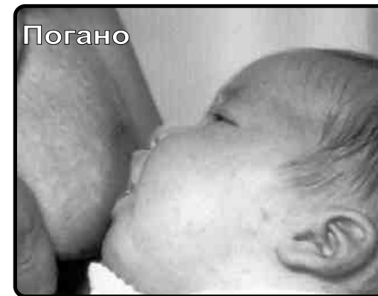
Дитина захвачує тільки сосок

Листівка виготовлена при сприянні Via Lactea до святкування Міжнародного Тижня Материнського Годування 2003-ього року. Таким чином хочемо побажати щасливого перебуття в Арагоні, матерям, що прибувають сюди з інших країн.