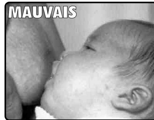
Le bébé ne prends que le mamelon.

Brochure élaboré par Vía Láctea pour la célébration de la Semaine Mondiale de l'Allaitement Maternel 2003. On veut aussi, de cette façon, donner la bienvenue à toutes les mères qui viennent en Aragón et qui procèdent d'un autre pays.