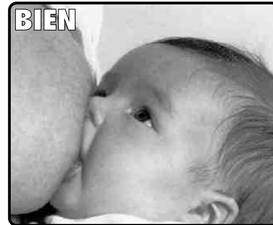
(Image de la brochure de la Consejería de Salud d'Andalousie sur l'allaitement maternel)

Le bébé embrasse avec sa bouche le mamelon et une bonne partie de l'aréole.