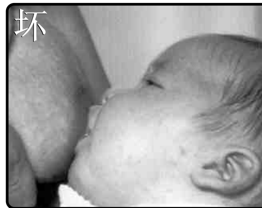
小宝宝只会拿奶头。

VIA LACTEA为庆祝2003年的世界母乳星期而做的小册子，与此同时我们也欢迎来自各地的母亲。