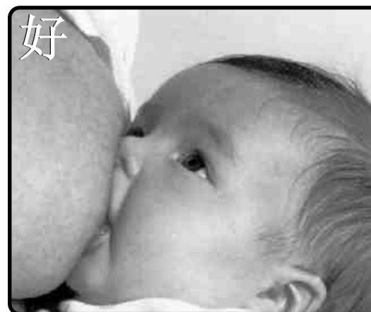
Lactancia Materna de la Consejería de Salud Andalucía 的小册子的介绍