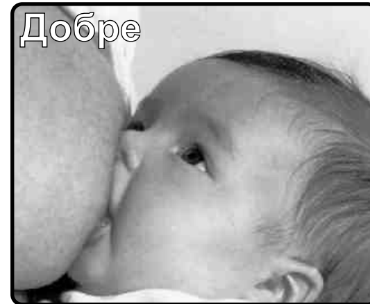
Картина от брошура за Майчината кърма на Анбалусийската Здравна организация

С устата си бебето обхваща гърдното зърно частта около него.