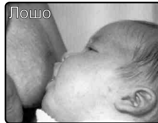
Бебето обхваща само гърдното зърно

Брошурата е изработена за "VIALACTEA" по случай честването на Световната седмица на Майчината кърма за 2003г. Също така, искаме да кажем своето "Добре дошли!" на всички майки, пристигащи в Арагон от своите държави.