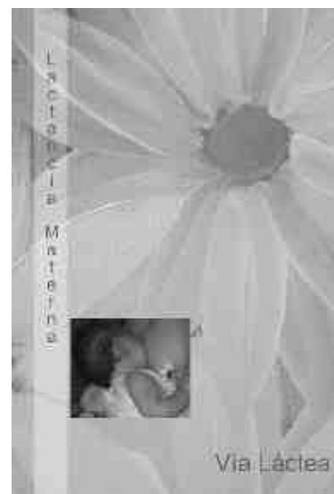
Portada de la Guía "Guía de Lactancia Materna".

Elaborada por Vía Láctea y editada por el Gobierno de Aragón